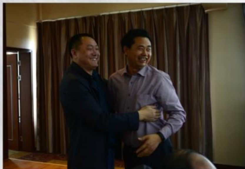
陕西正泰建设有限公司与扬州天成建筑安装工程公司结为友好企业董事长合影