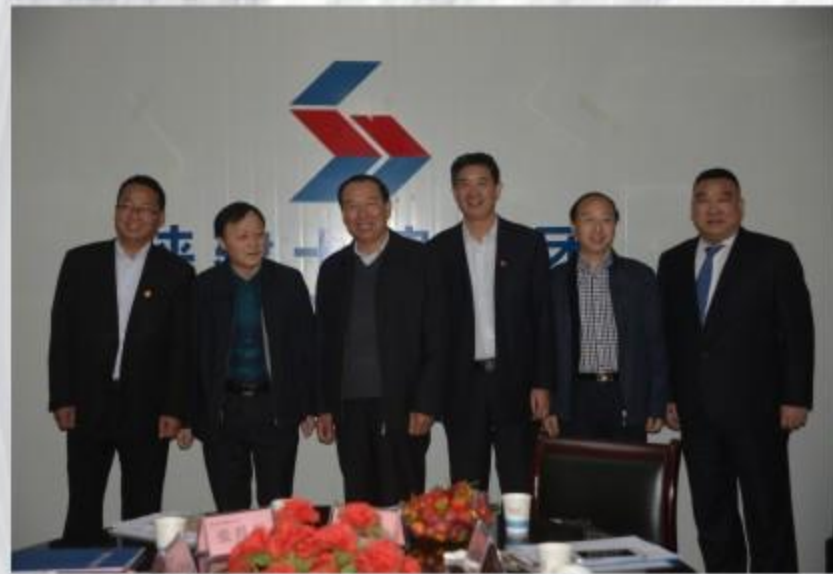
陕西建工第十建设集团与扬州邗建集团结为友好企业合影