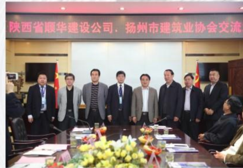
陕西顺华建设有限公司与江苏润泽建设有限公司结为友好企业合影