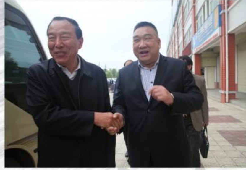
两市建筑业协会会长在汉中亲切握手