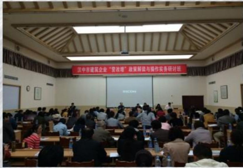
汉中市建筑业协会在茶城举办“营改增”研讨班开幕式