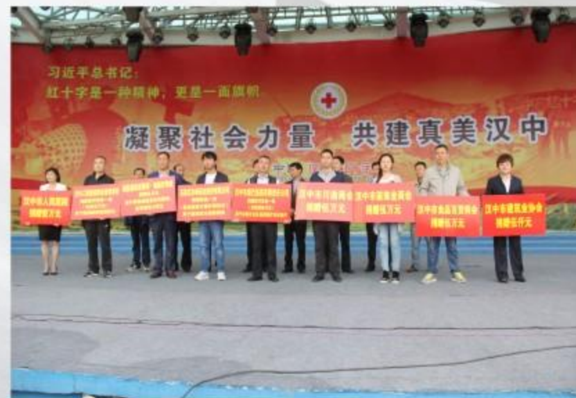
汉中市建筑业协会参加汉中市红十字会捐赠活动